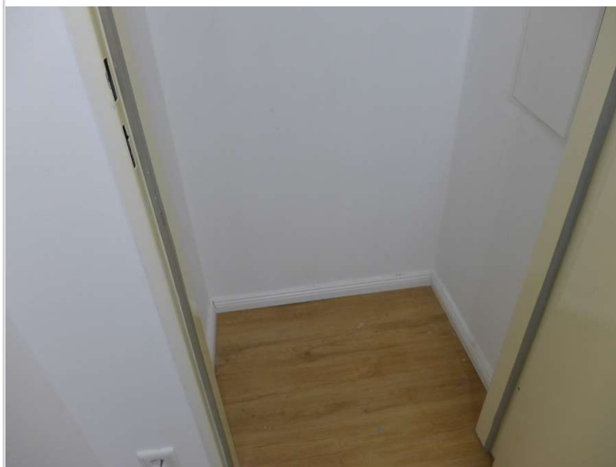
Abstellkammer im Flur