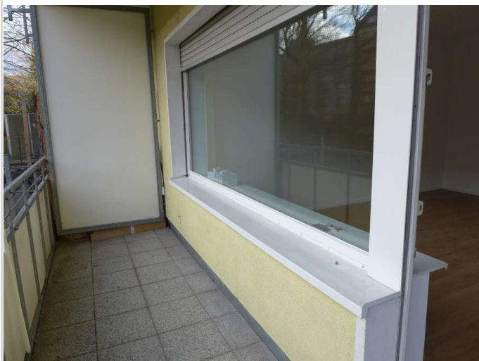
Balkon Bild 2

Zimmer: 1,00 Wohnfläche ca.: 42,23 m 2 Kaltmiete: 560,00 EUR (zzgl. Nebenkosten) Gesamtmiete: 770,00 EUR