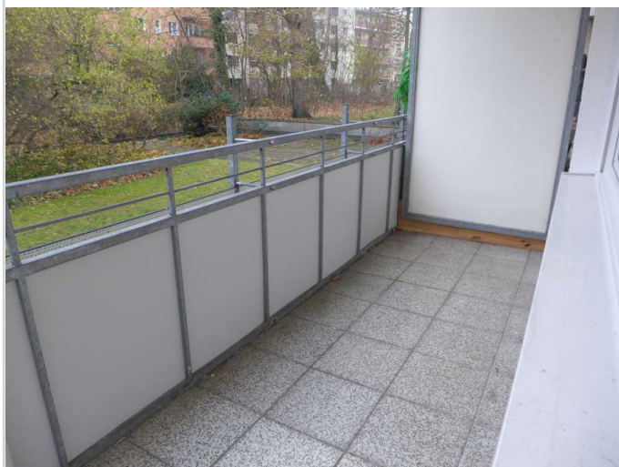
Balkon Bild 1