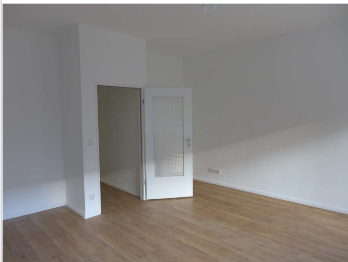
Wohnzimmer Bild 2

Zimmer: 1,00 Wohnfläche ca.: 42,23 m 2 Kaltmiete: 560,00 EUR (zzgl. Nebenkosten) Gesamtmiete: 770,00 EUR