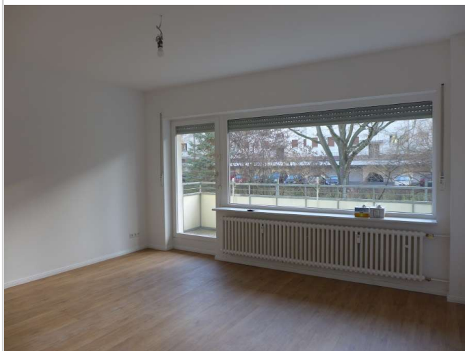
Wohnzimmer Bild 3