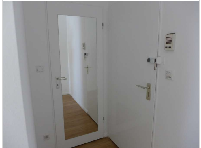
Eingangsbereich Bild 1