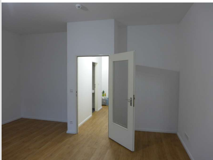
Wohnzimmer Bild 4