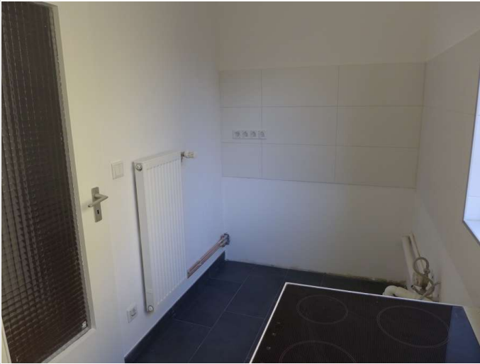
EBK in Planung S.Küchenansicht

Zimmer: 1,00 Wohnfläche ca.: 42,23 m 2 Kaltmiete: 560,00 EUR (zzgl. Nebenkosten) Gesamtmiete: 770,00 EUR